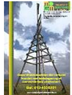
Folder van het MGM

Het MGM maakt voor het vastleggen van meldingen van milieugerelateerde gezondheidsklachten gebruik van een centraal meldnummer: 010-4558201 en van een digitaal meldformulier ( http://www.meldpuntgezondheidenmilieu.nl/documenten/lbalk/registratieformulier.php ). De centrale meldlijn wordt bemenst door vrijwilligers die het 1 e aanspreekpunt zijn voor meldingen en vragen van burgers. Zij registreren meldingen en beantwoorden vragen. Eenvoudige verzoeken om hulp of om het toesturen van informatie handelen zij zelf af. Voor meer ingewikkelde kwesties en hulpvragen kunnen zij verschillende deskundigen raadplegen binnen de organisatie. Dit zijn per specifiek onderwerp gespecialiseerde consulenten, eveneens vrijwilligers, doorgaans met een wetenschappelijke achtergrond.