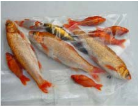
Dode vissen uit de vijver

Naar aanleiding van meldingen en hulpvragen zoeken medewerkers van het MGM ook zelf contact met onderzoekers of instanties om aan te dringen op nader onderzoek naar zaken, die volgens het MGM aandacht verdienen. De casus Overslag is daar een goed voorbeeld van: