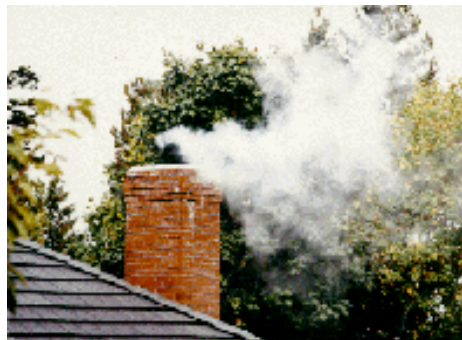
Netwerk wijdt een uitzending aan stookklachten