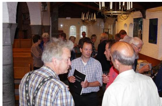
Foto's van de bijeenkomst op 31 mei Gebakken lucht in plaats van schone lucht in Nijmegen.