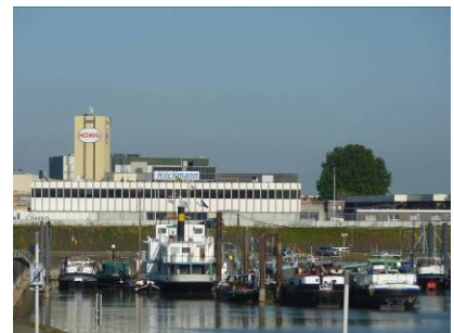
Foto's industrieterrein Nijmegen rond Waal en Maas-Waalkanaal.