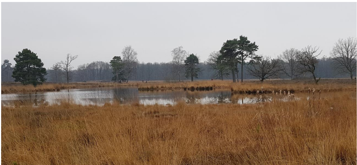
#MijnNatuurBlijft: Uitzicht over de Overasseltse en Hatertse vennen bij Nijmegen

Zie ook: https://www.mijnnatuurblijft.nl/